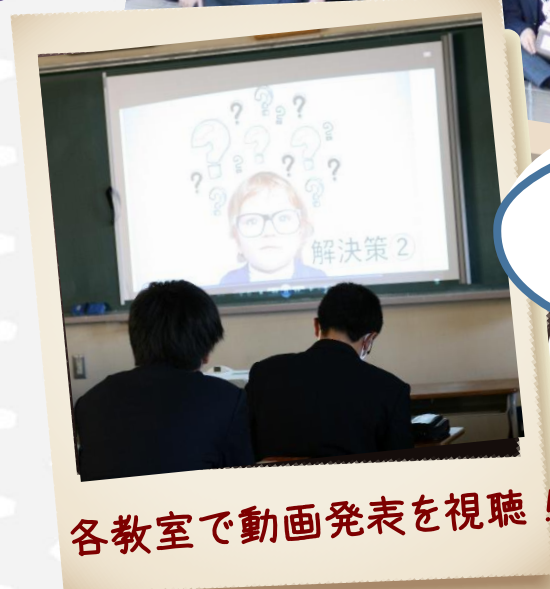
各教室で動画発表を視聴!